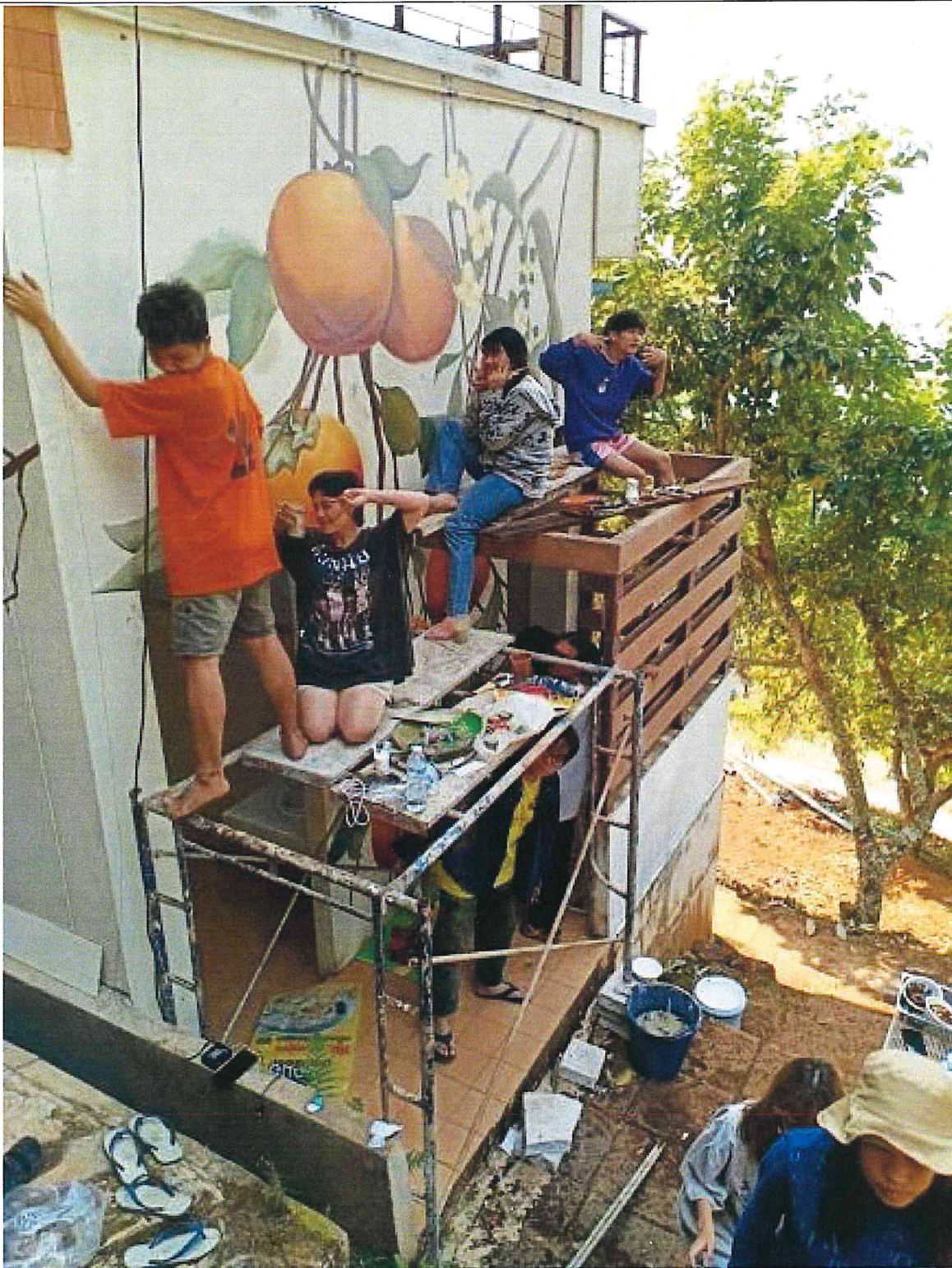
กรณีเป็น