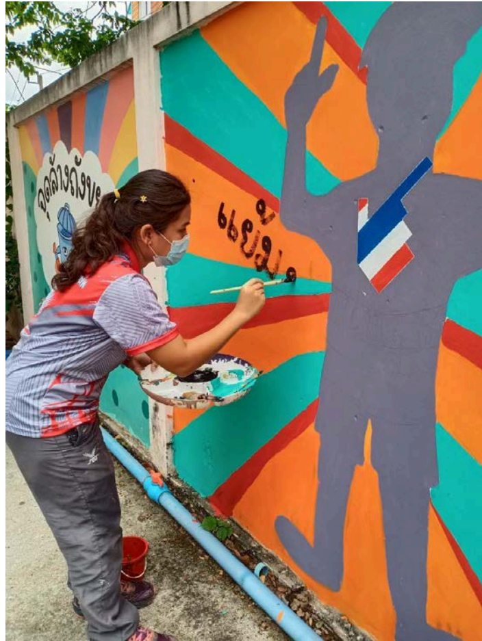
โรงเรียนสามแยกคลองหล่อแหล กรุงเทพฯ